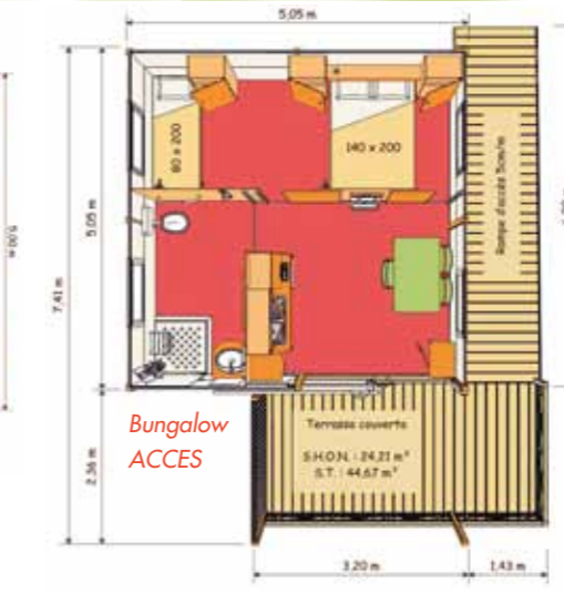
Bungalow ACCES ca. 25 m 2 , bis maximal 3 Personen